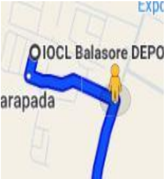
IMAGE: RIGHT TURN ;RiskLevel: MEDIUM ;Coordinates: 21.4945848,86.8484838 (0.4 Km)