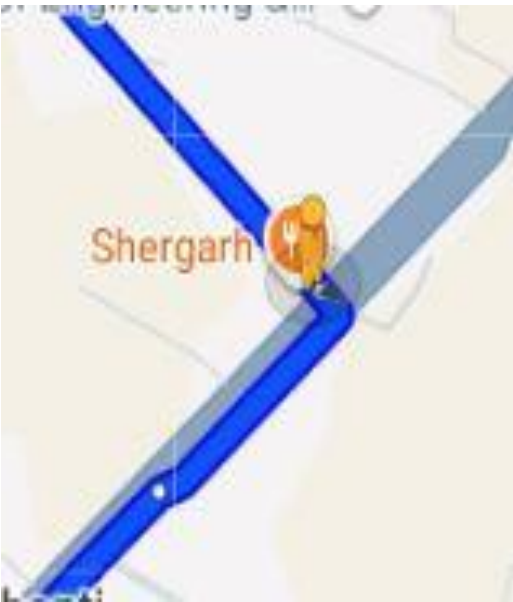
IMAGE: RIGHT TURN ;RiskLevel: HIGH ;Coordinates: 21.4360985, 86.8434255 (7.9 Km)