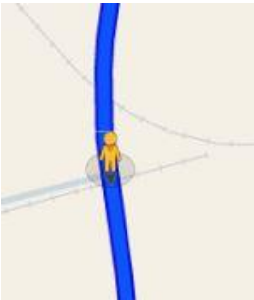
IMAGE: RAILWAY CROSSING ;RiskLevel: HIGH ;Coordinates: 21.4883721,86.8473507 (1.1 Km)