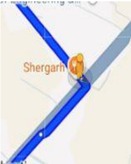
IMAGE: STRAIGHT ;RiskLevel: HIGH ;Coordinates: 21.4360985, 86.8434255 (7.9 Km)