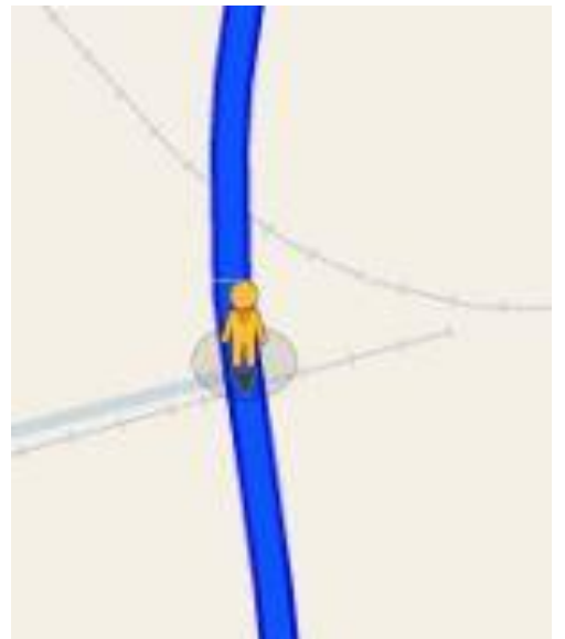
IMAGE: RAILWAY CROSSING ; RiskLevel: HIGH ; Coordinates: 21.4883721,86.8473507 (1.1 Km)