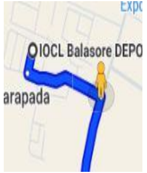
IMAGE: RIGHT TURN ; RiskLevel: MEDIUM ; Coordinates: 21.4945848,86.8484838 (0.4 Km)