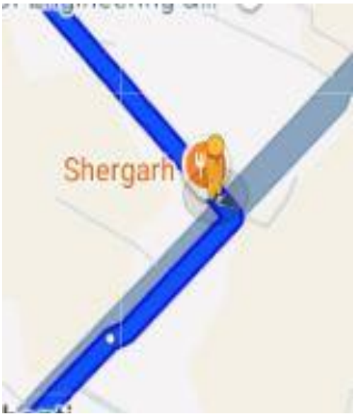
IMAGE: RIGHT TURN ; RiskLevel: HIGH ; Coordinates: 21.4360985, 86.8434255 (7.9 Km)