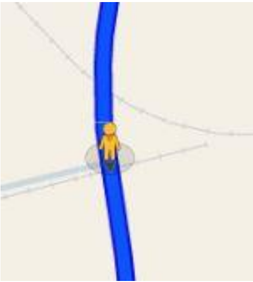
IMAGE: RAILWAY CROSSING ;RiskLevel: HIGH ;Coordinates: 21.4883721,86.8473507 (1.1 Km)