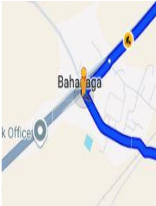
IMAGE: LEFT TURN ; RiskLevel: HIGH ; Coordinates: 21.42488, 86.83009 (22 Km)