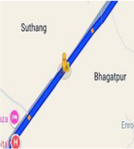
IMAGE: STRAIGHT ; RiskLevel: MEDIUM ; Coordinates: 21.4233292, 86.8284454 (10.10 Km)