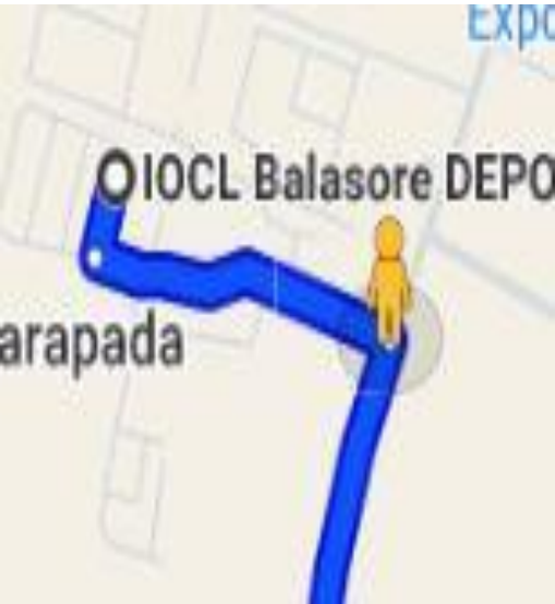
IMAGE: RIGHT TURN ;RiskLevel: MEDIUM ;Coordinates: 21.4945848,86.8484838 (0.4 Km)