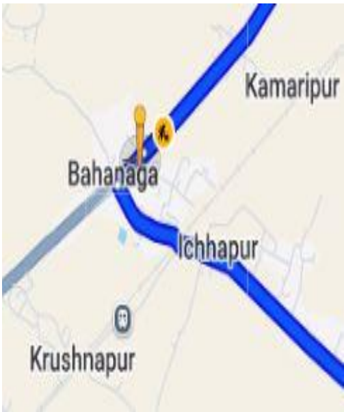
IMAGE: LEFT TURN ; RiskLevel: MEDIUM ; Coordinates: 21.3418956, 86.7628016 (21.8 Km)