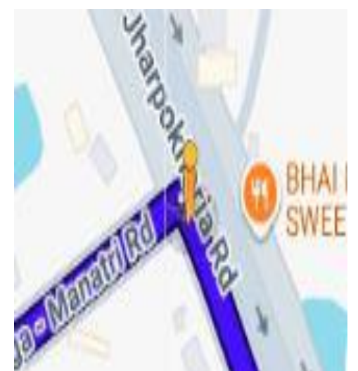
IMAGE: LEFT TURN ; RiskLevel: MEDIUM ; Coordinates: 21.5705185,86.8575081 (22.1 Km)