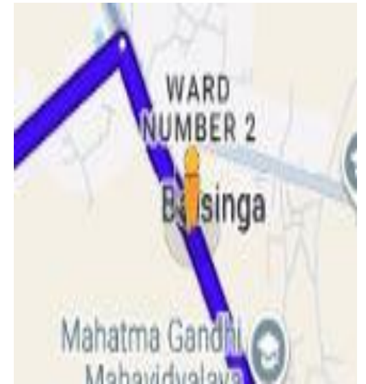
IMAGE: EXIT HIGHWAY ; RiskLevel: MEDIUM ; Coordinates: 21.6459894,86.9135911 (20 Km)