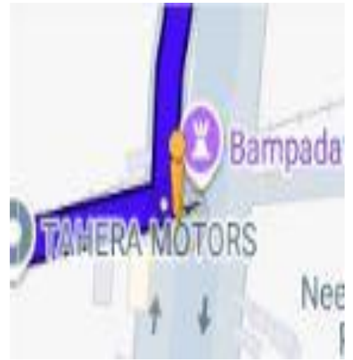
IMAGE: LEFT TURN ; RiskLevel: HIGH ; Coordinates: 21.4933617,86.8889992 (5.1 Km)