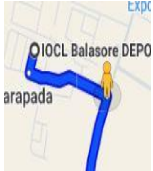
IMAGE: LEFT TURN ; RiskLevel: MEDIUM ; Coordinates: 21.4945848,86.8484838 (0.4 Km)