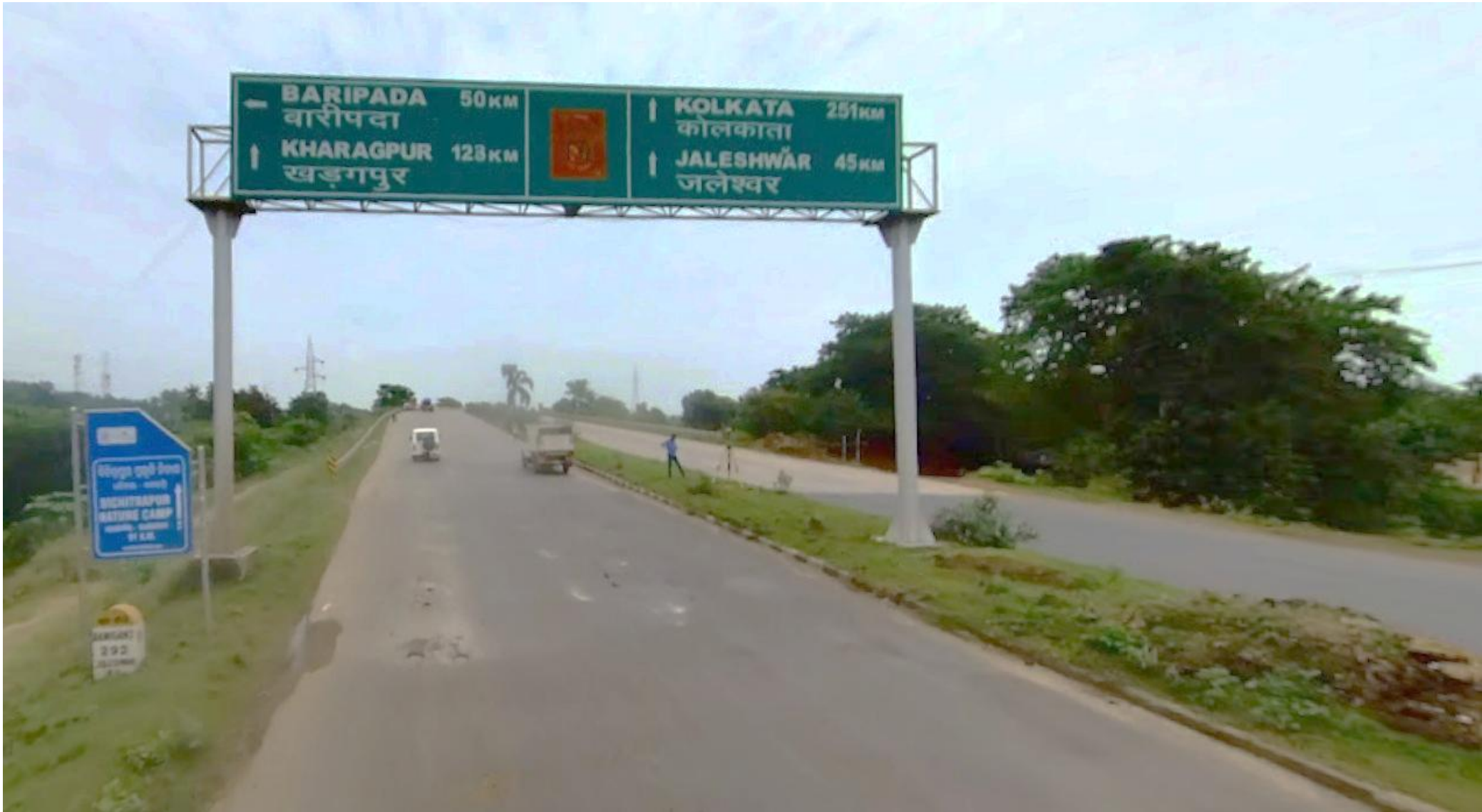
IMAGE: BRIDGE ;RiskLevel: MEDIUM ;Coordinates: 21.5500951,86.9218915