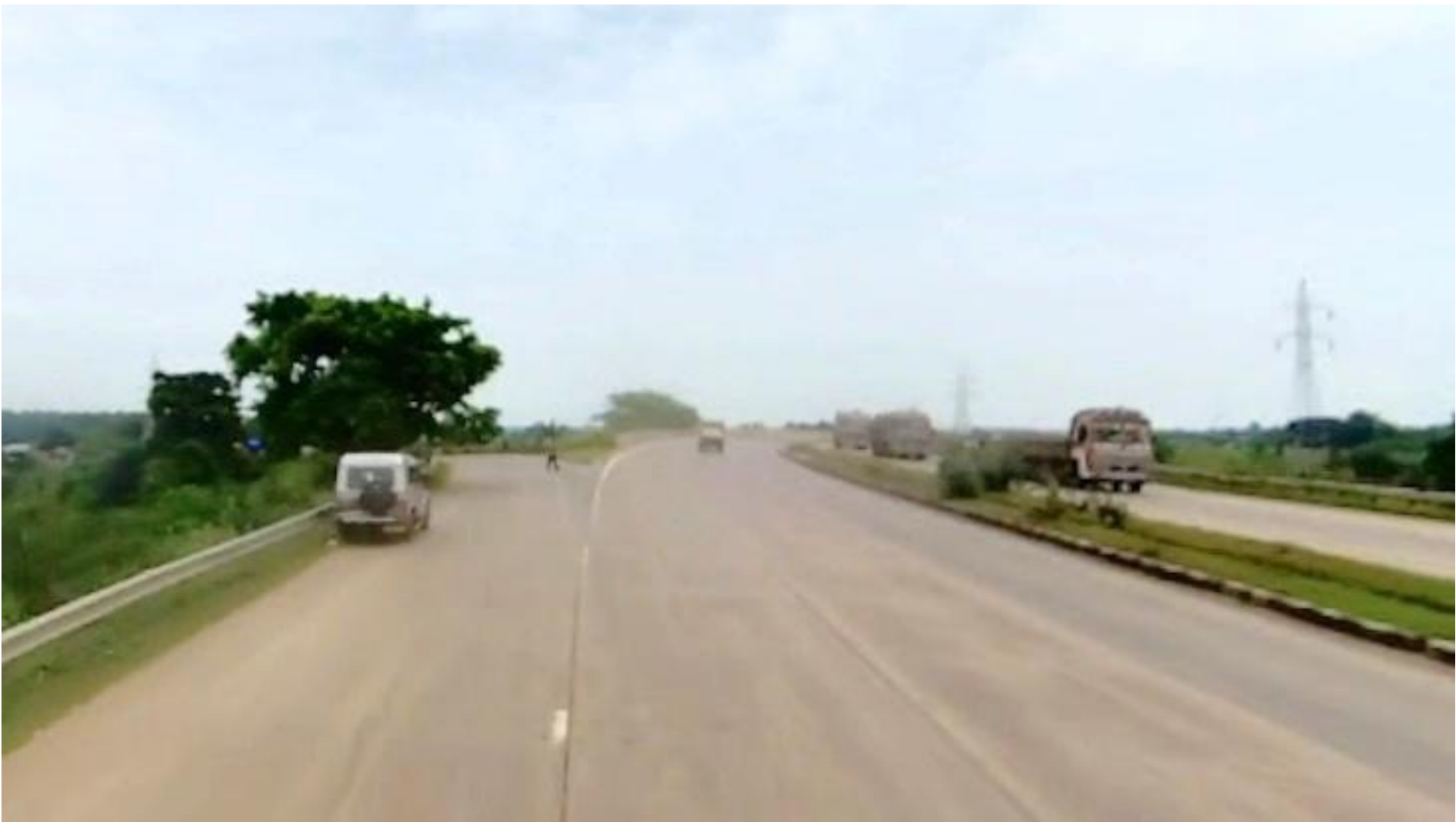
IMAGE: SHARP TURN LEFT ;RiskLevel: HIGH ;Coordinates: 21.550605,86.9232643