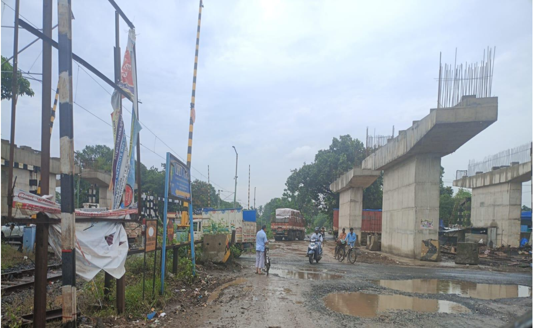
IMAGE: SHARP TURN LEFT ; RiskLevel: HIGH ; Coordinates: 21.493375, 86.888745