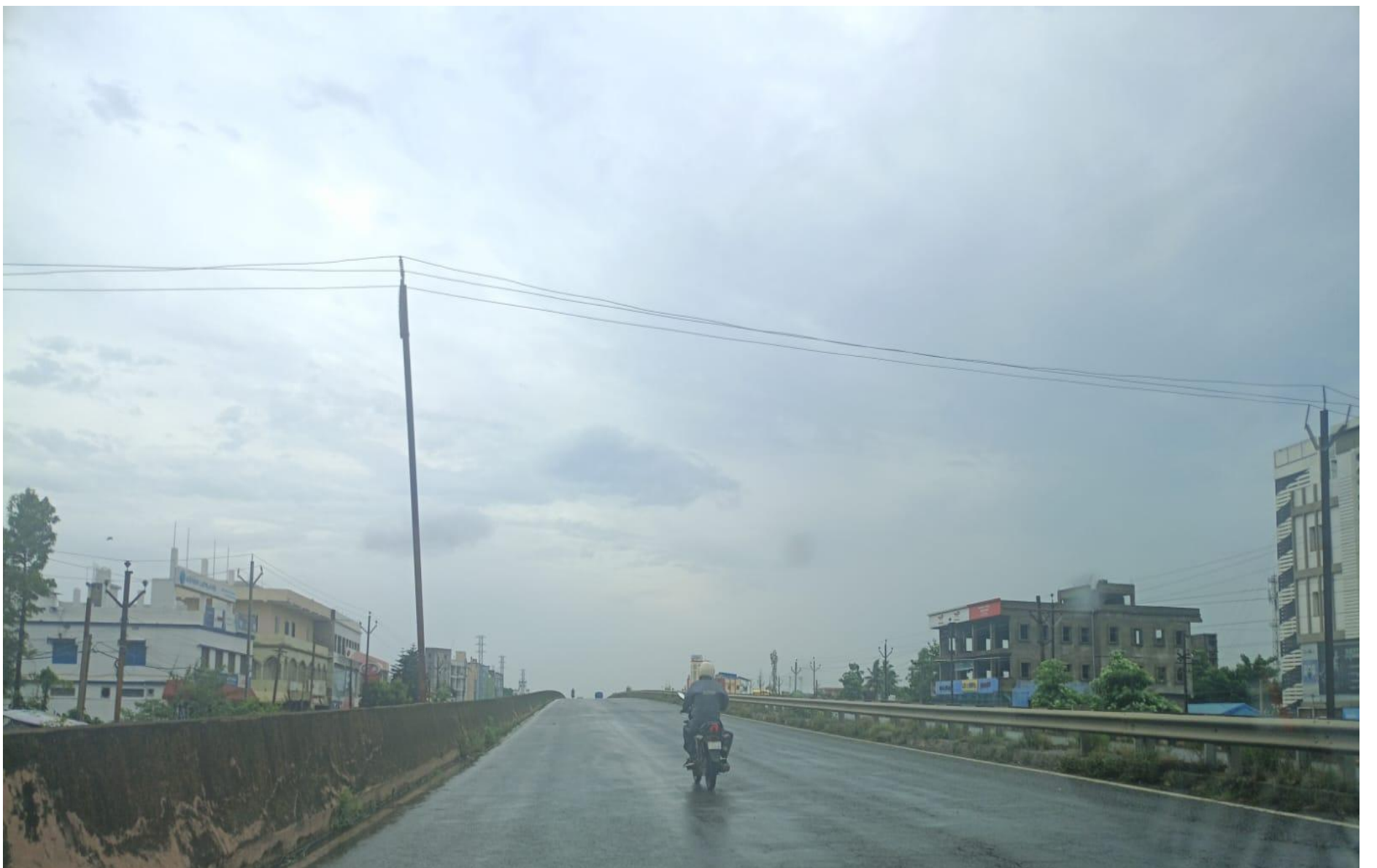
IMAGE: STRAIGHT ; RiskLevel: MEDIUM ; Coordinates: 21.511436, 86.892188