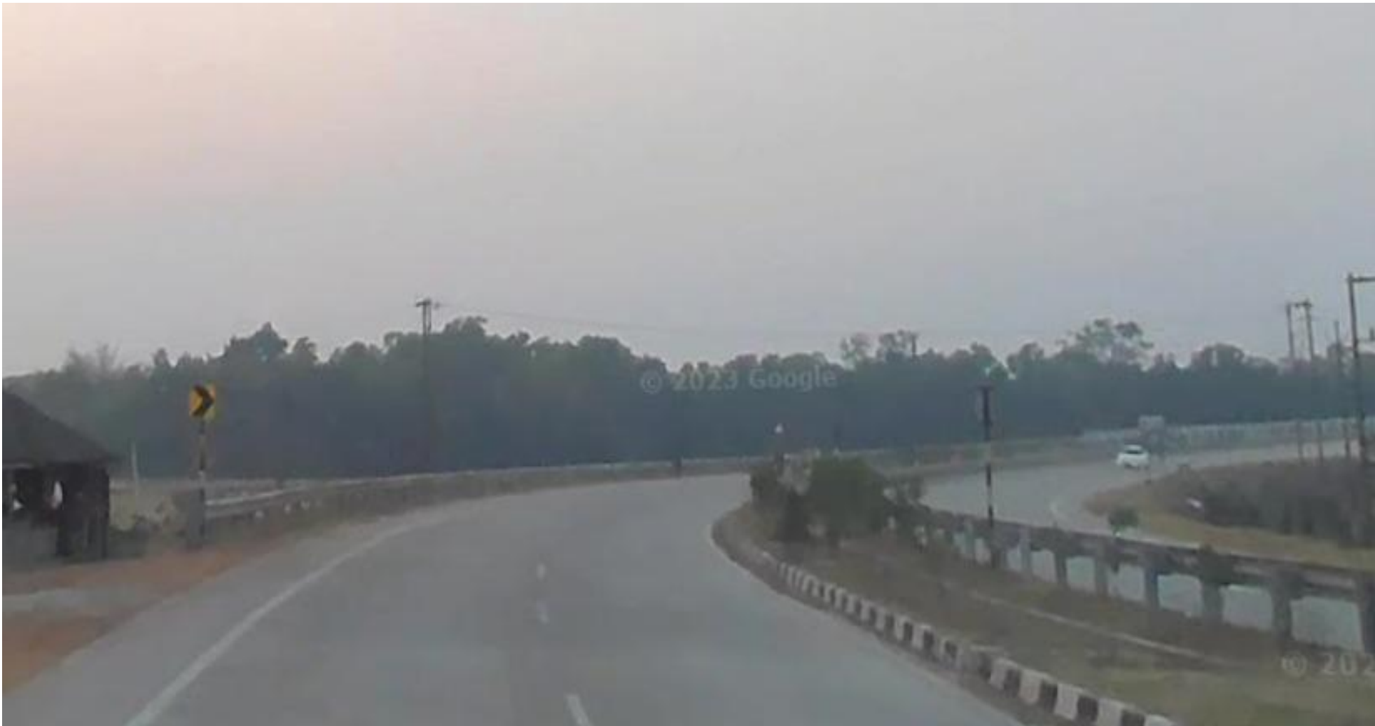
IMAGE: RIGHT TURN ;RiskLevel: MEDIUM ;Coordinates: 21.700134,86.8730852