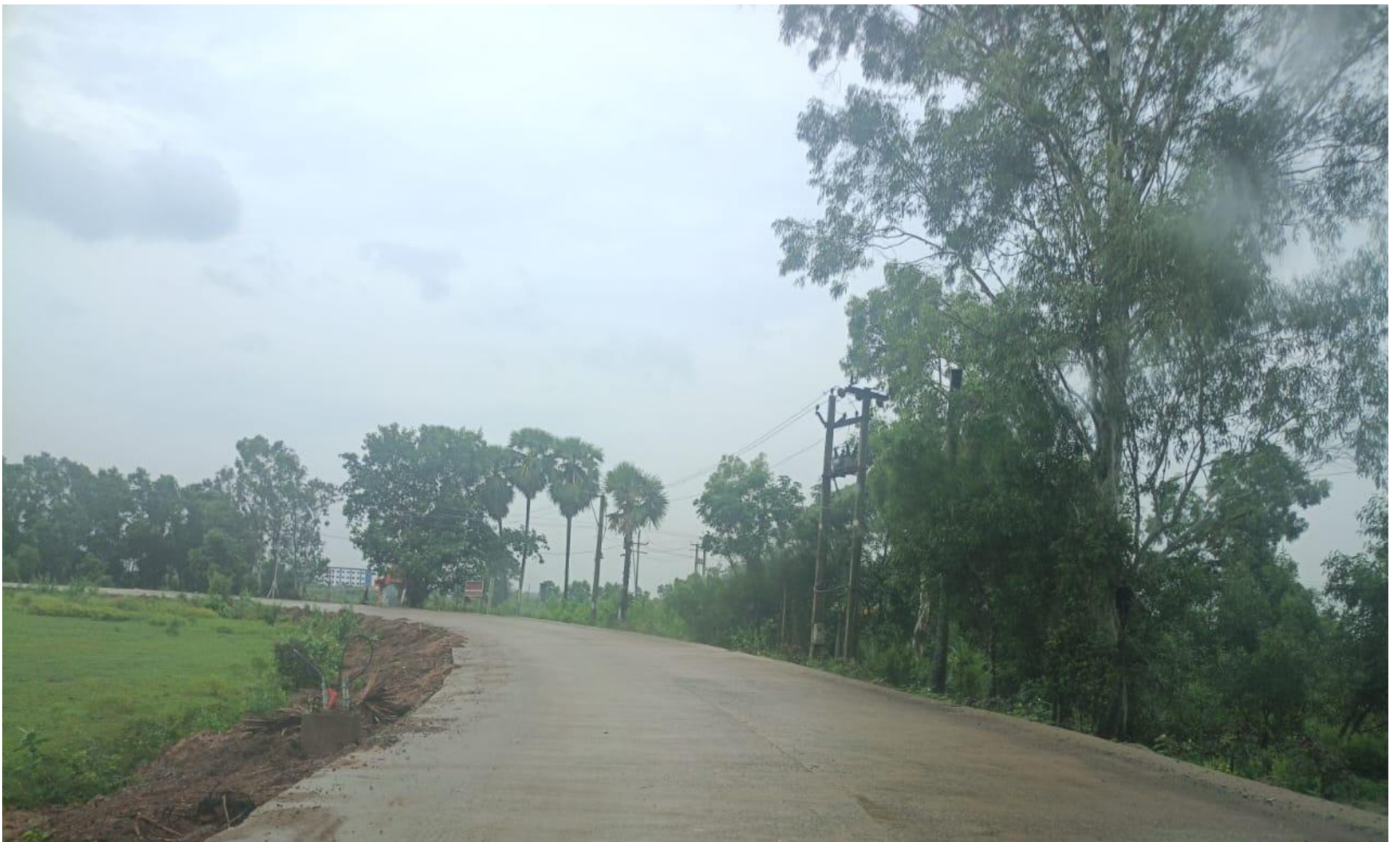
IMAGE: SHARP TURN LEFT ; RiskLevel: HIGH ; Coordinates: 21.489892, 86.861618