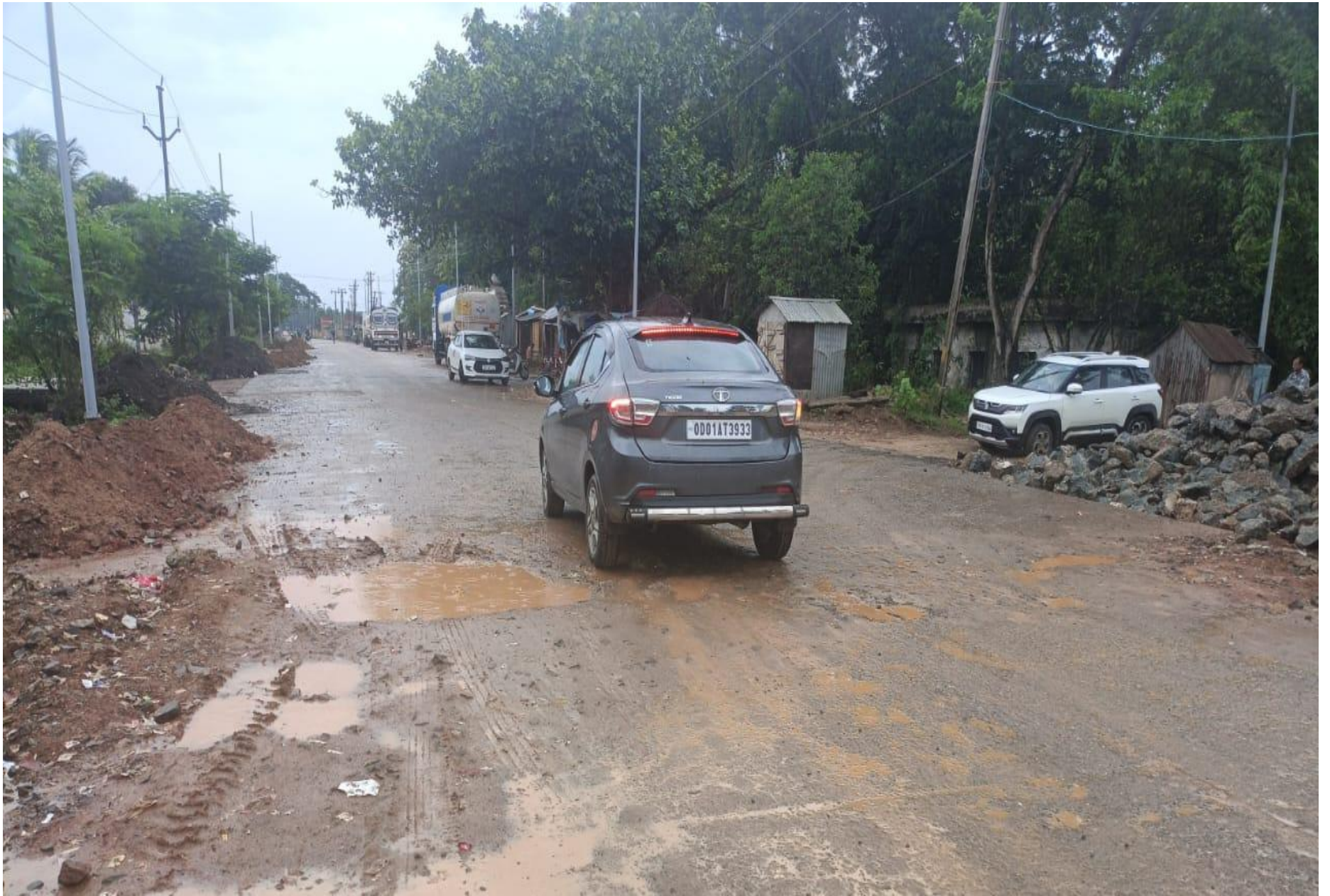
IMAGE: SHARP TURN RIGHT ; RiskLevel: HIGH ; Coordinates: 21.495242, 86.84884