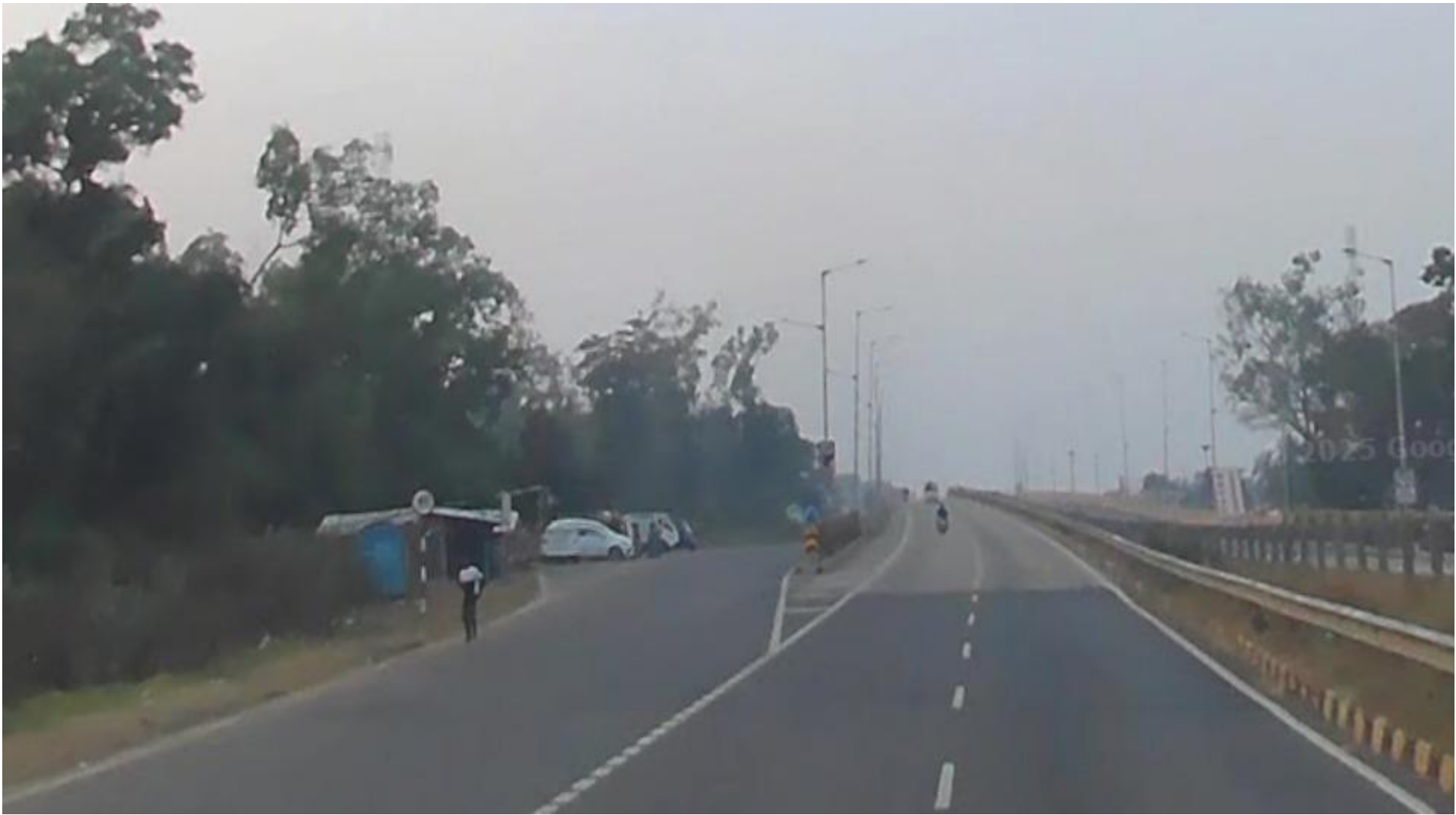
IMAGE: LEFT TURN ;RiskLevel: MEDIUM ;Coordinates: 21.6458847,86.9136692