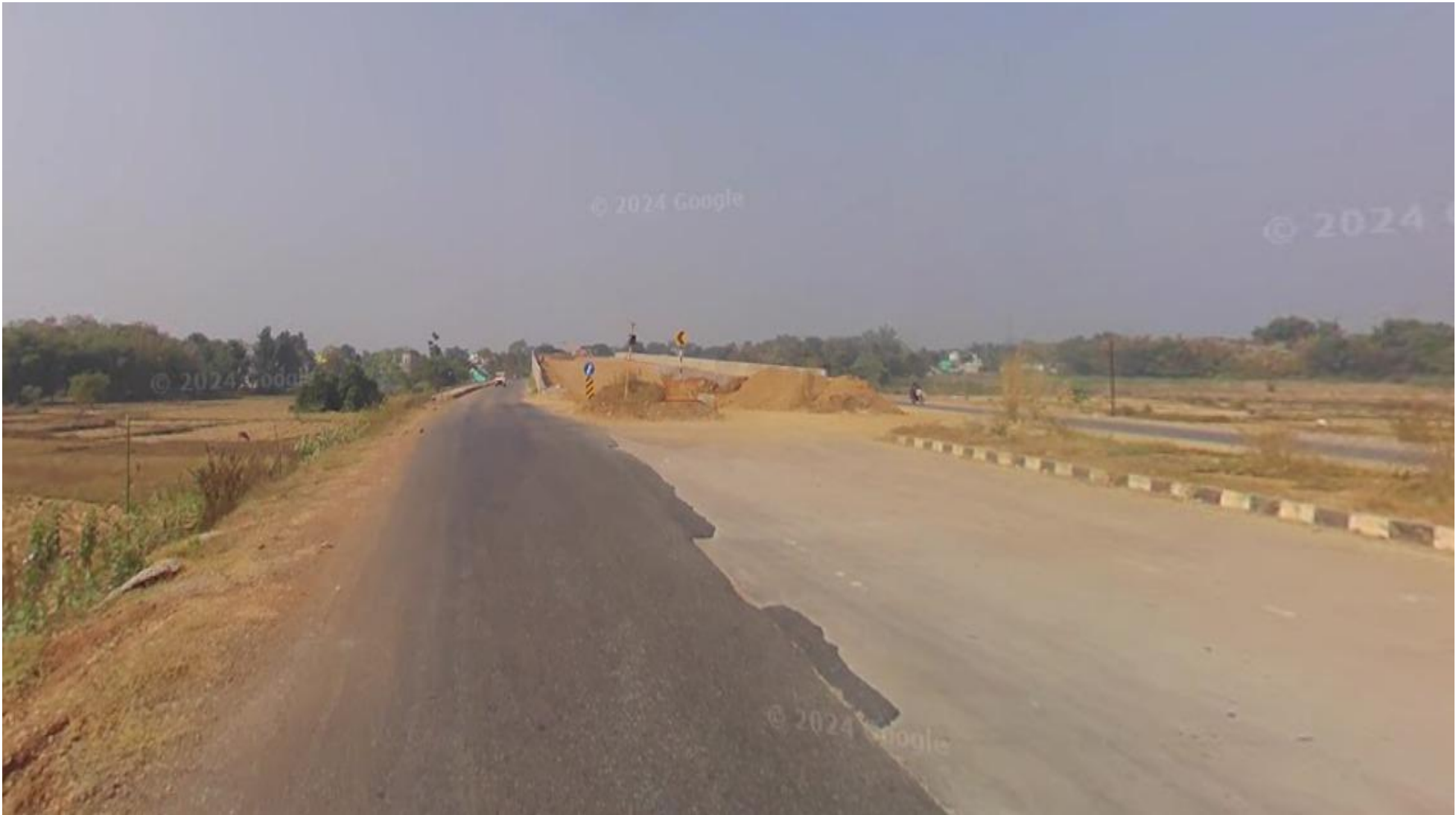
IMAGE: STRAIGHT ; RiskLevel: MEDIUM ; Coordinates: 22.0846498, 86.6404366