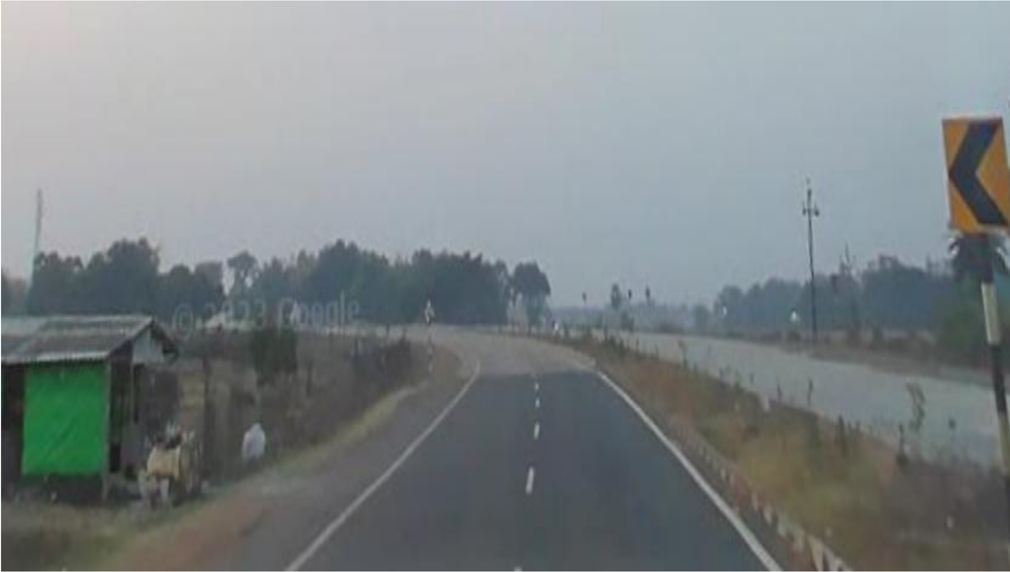
IMAGE: LEFT TURN ;RiskLevel: MEDIUM ;Coordinates: 21.6977334,86.8773611