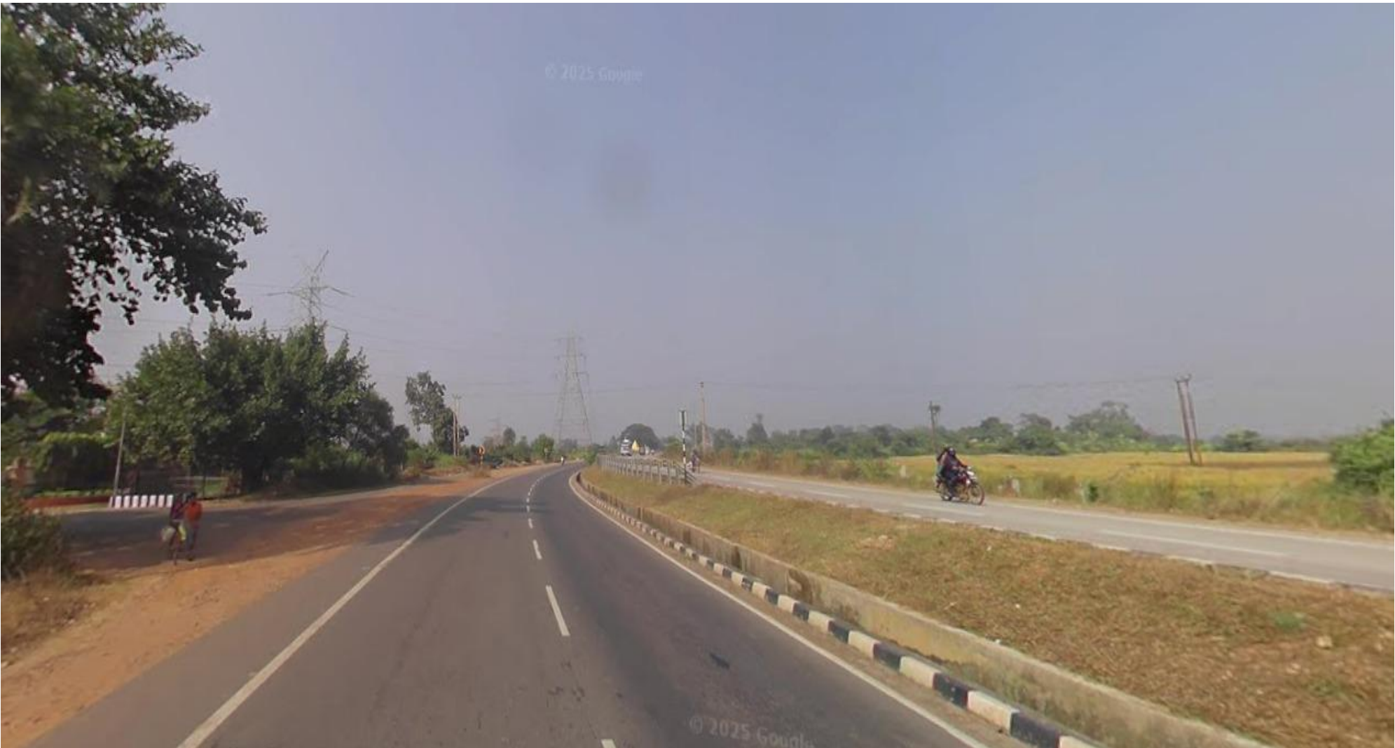
IMAGE: STRAIGHT ; RiskLevel: MEDIUM ; Coordinates: 21.9892065,86.700048