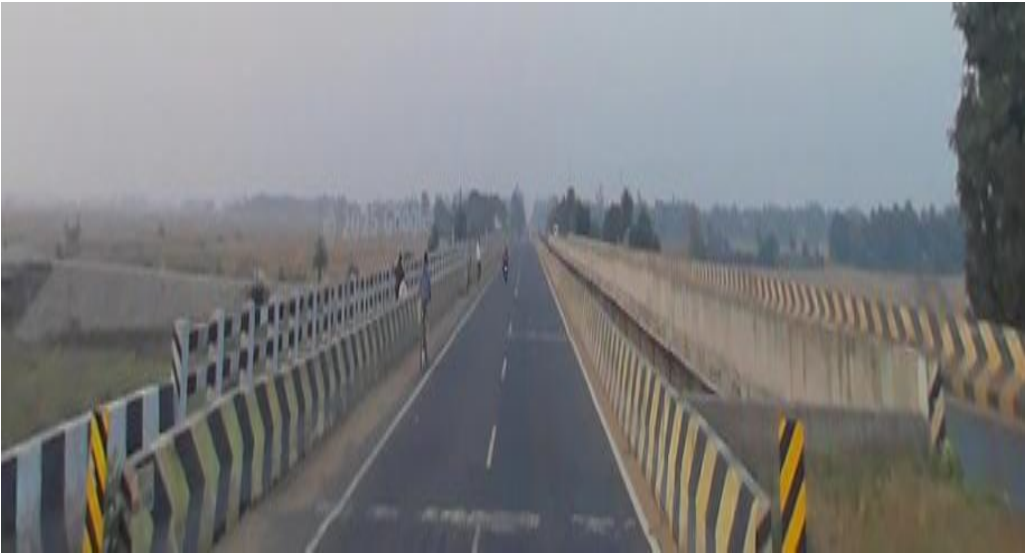
IMAGE: BRIDGE ;RiskLevel: MEDIUM ;Coordinates: 21.5810782,86.9292017