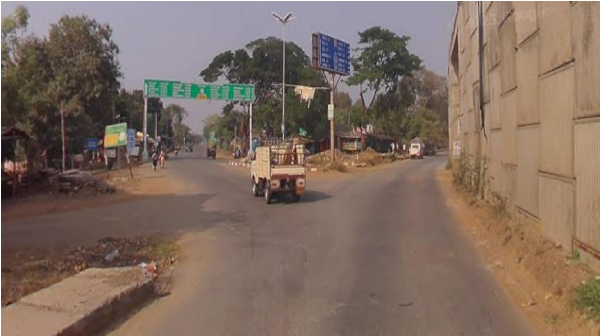
IMAGE: LEFT TURN ; RiskLevel: MEDIUM ; Coordinates: 22.0877891, 86.6397381