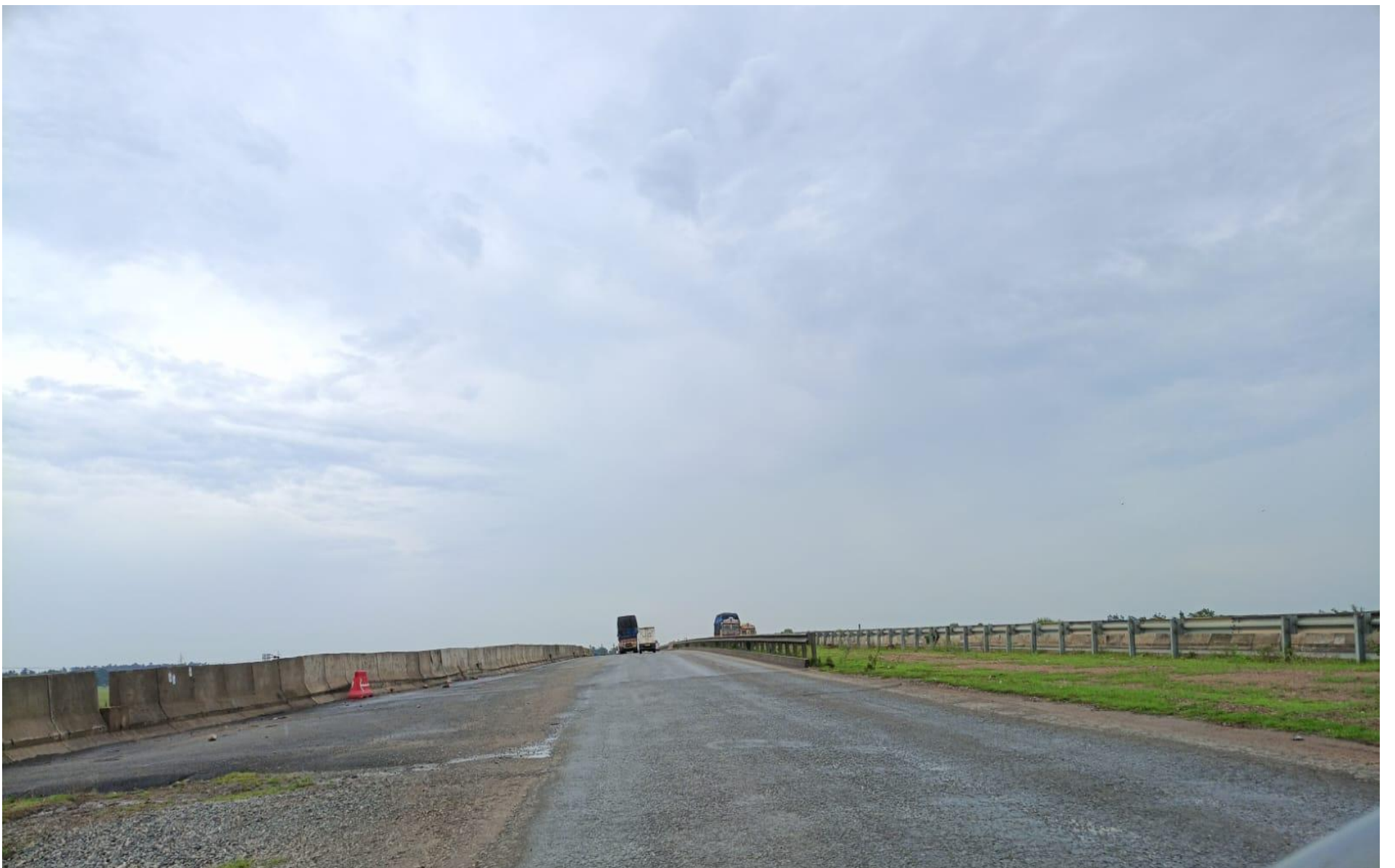
IMAGE: STRAIGHT ; RiskLevel: HIGH ; Coordinates: 21.538488, 86.90128