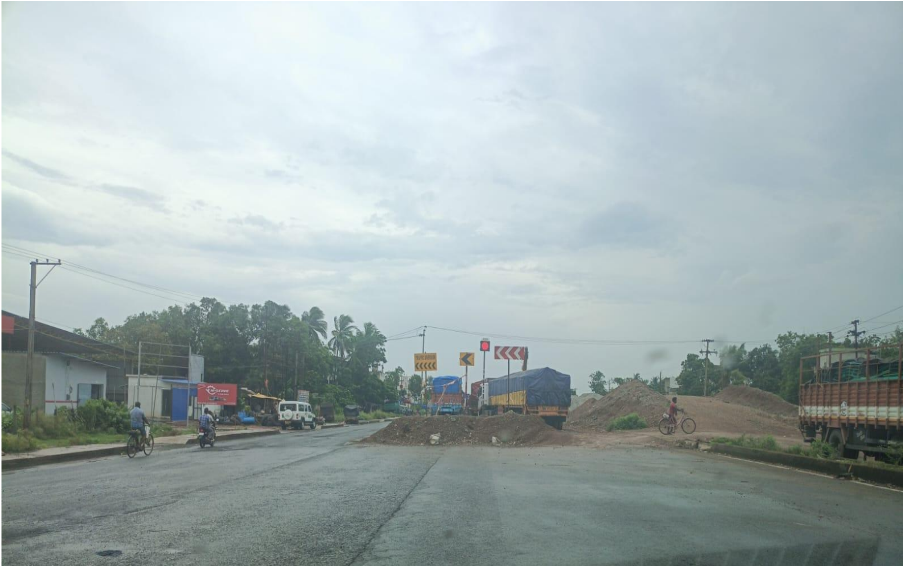
IMAGE: SHARP TURN LEFT ; RiskLevel: HIGH ; Coordinates: 21.525135, 86.895252