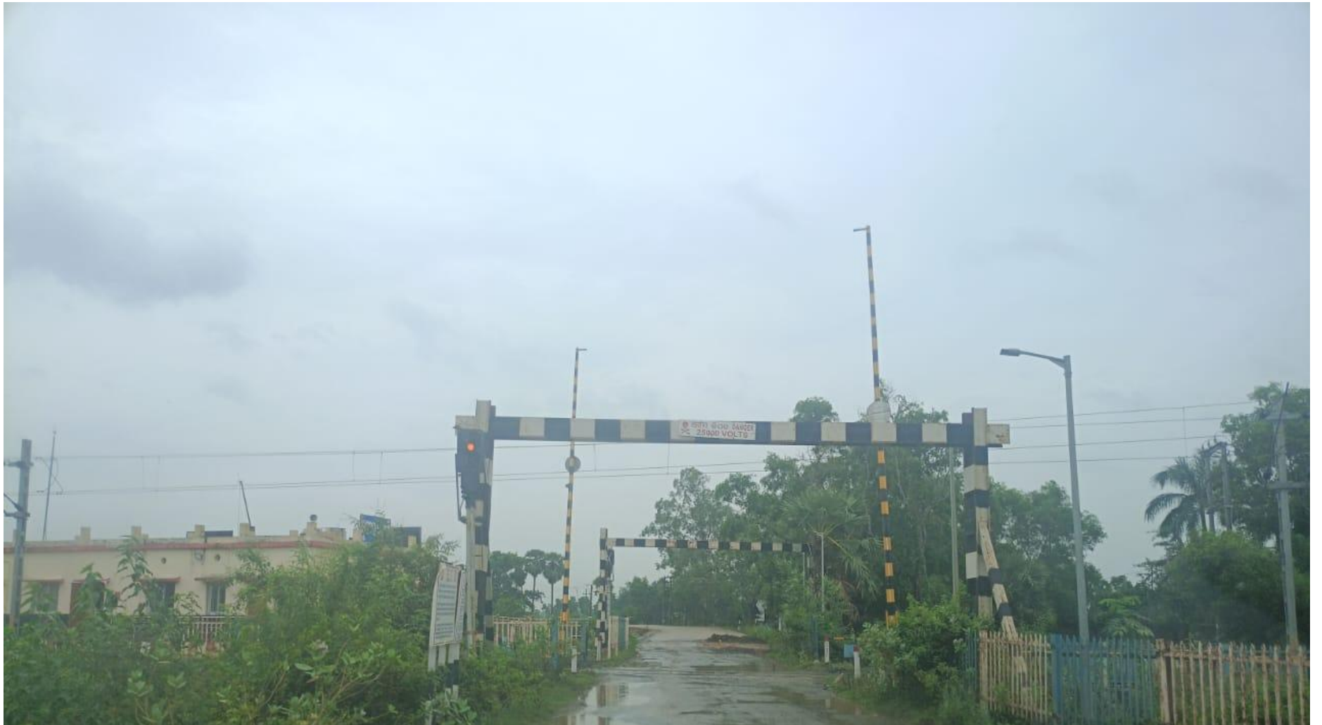
IMAGE: CROSSING ; RiskLevel: HIGH ; Coordinates: 21.490679, 86.861366