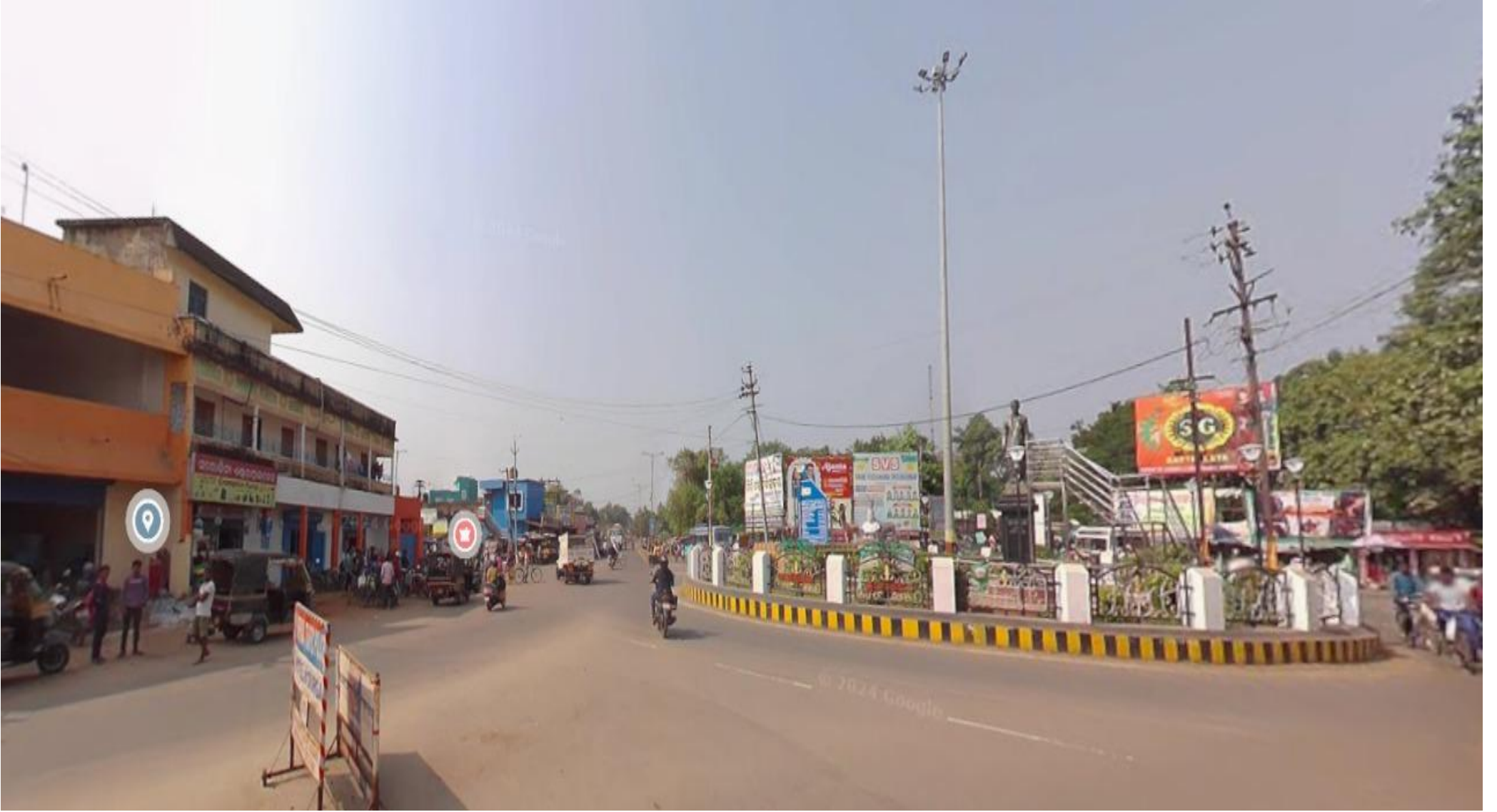
IMAGE: TAKE 2 ND EXIT ; Risk Level: HIGH ; Coordinates: 21.9281133, 86.7275345