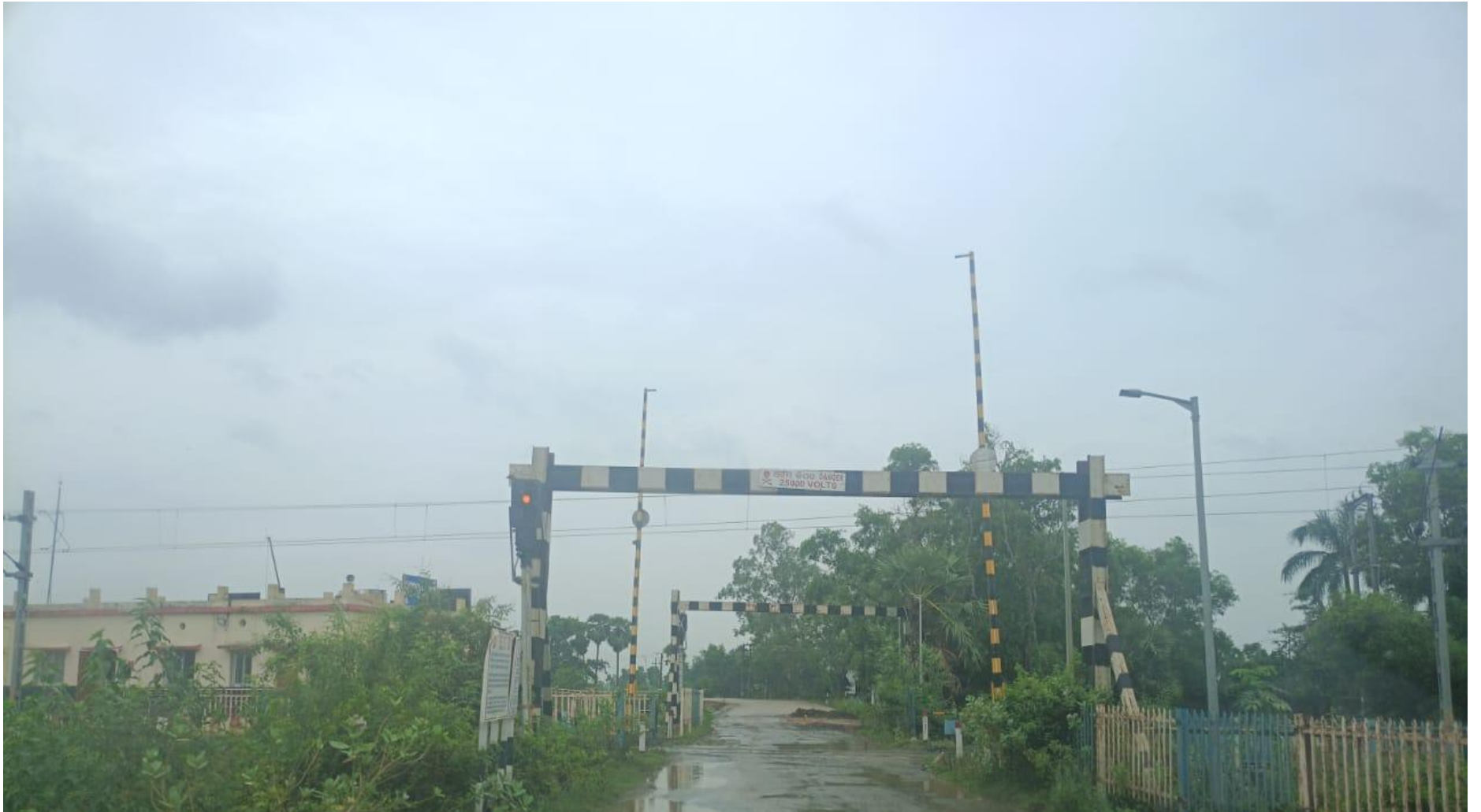
IMAGE: CROSSING ; Risk Level: HIGH ; Coordinates: 21.490679, 86.861366