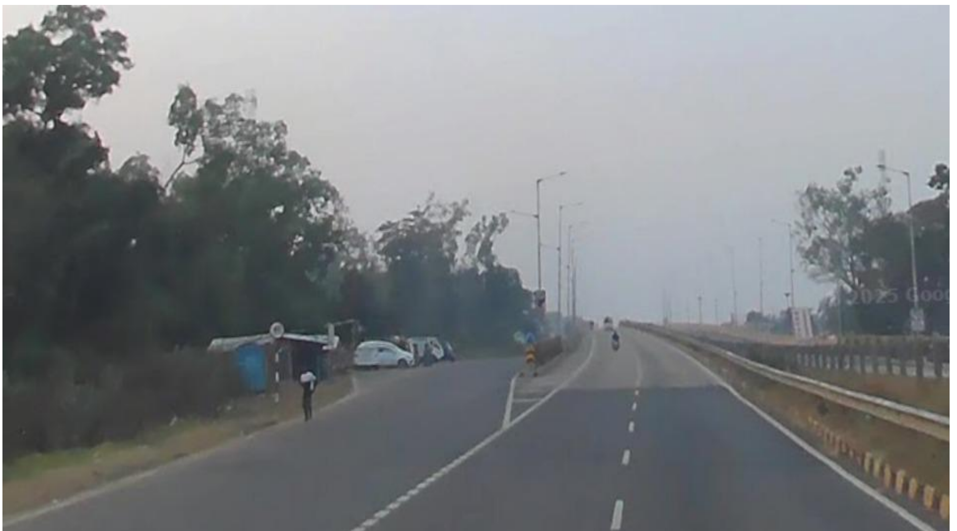
IMAGE: LEFT TURN ; Risk Level: MEDIUM ; Coordinates: 21.6458847,86.9136692