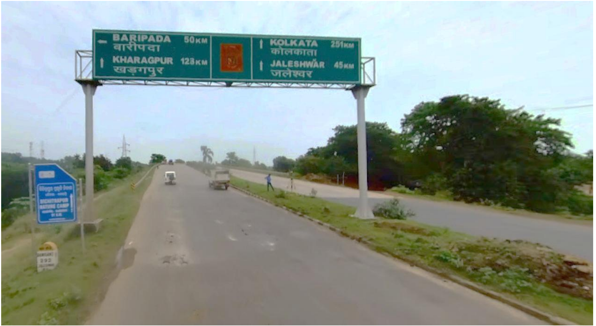
IMAGE: BRIDGE ; Risk Level: MEDIUM ; Coordinates: 21.5500951,86.9218915