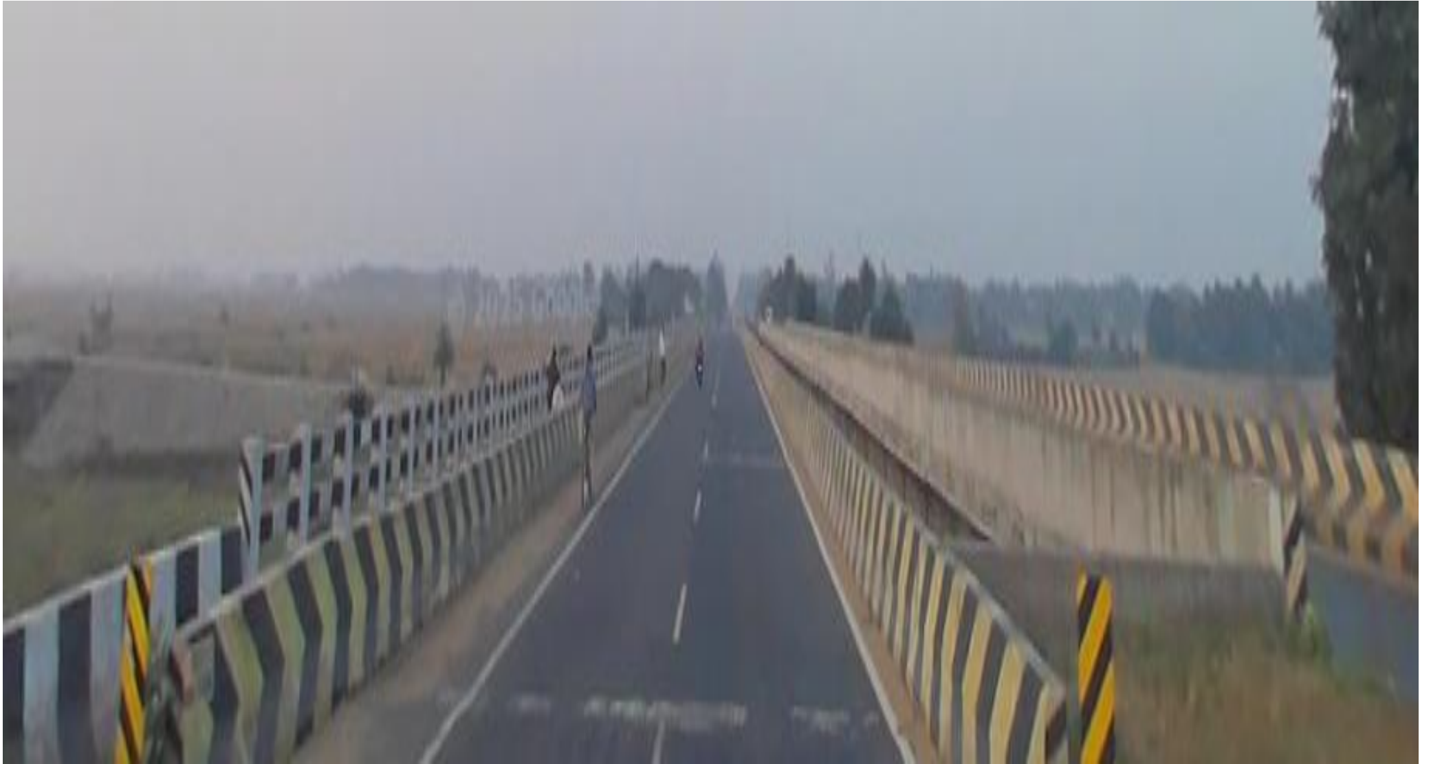
IMAGE: BRIDGE ; Risk Level: MEDIUM ; Coordinates: 21.5810782,86.9292017