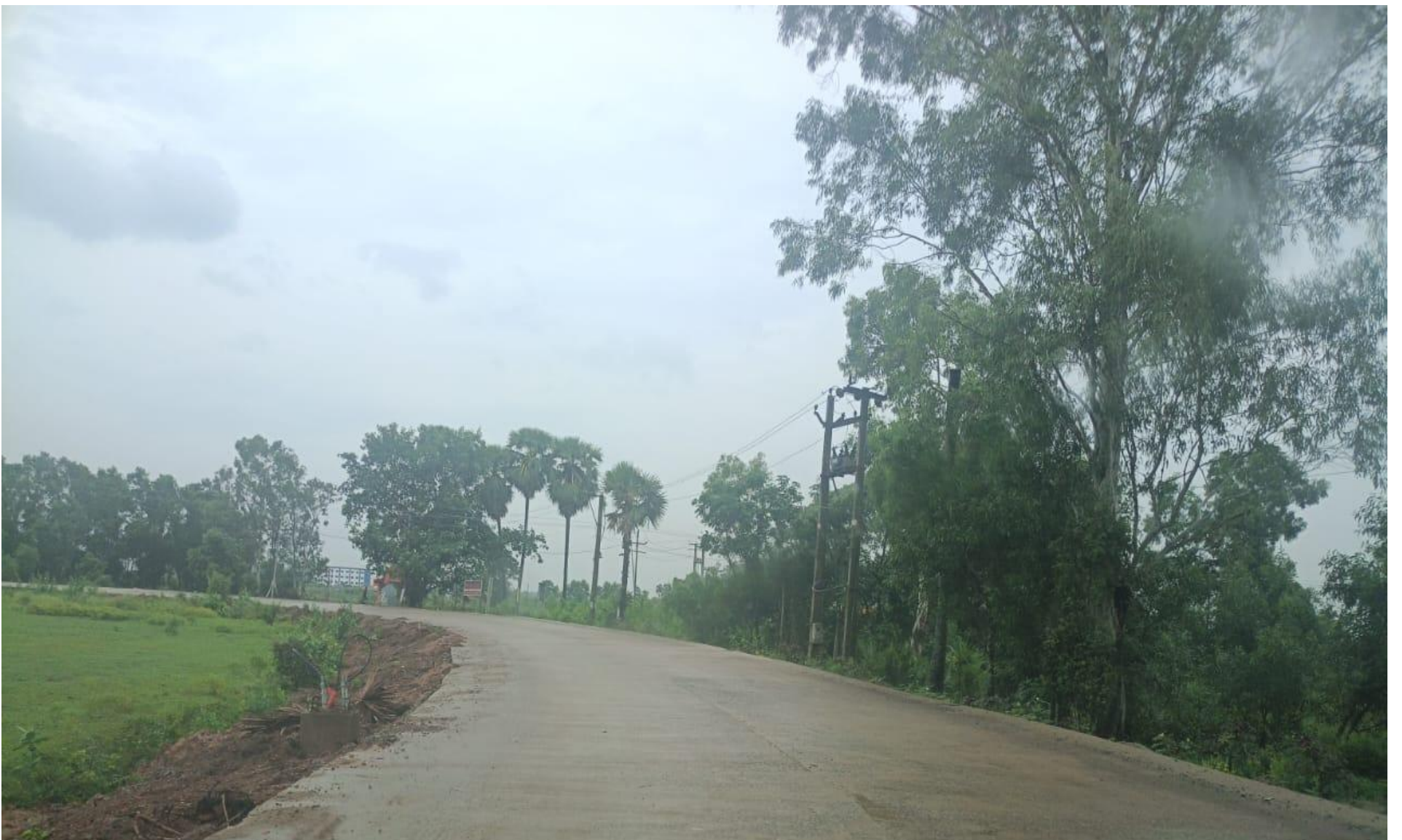
IMAGE: SHARP TURN LEFT ; Risk Level: HIGH ; Coordinates: 21.489892, 86.861618