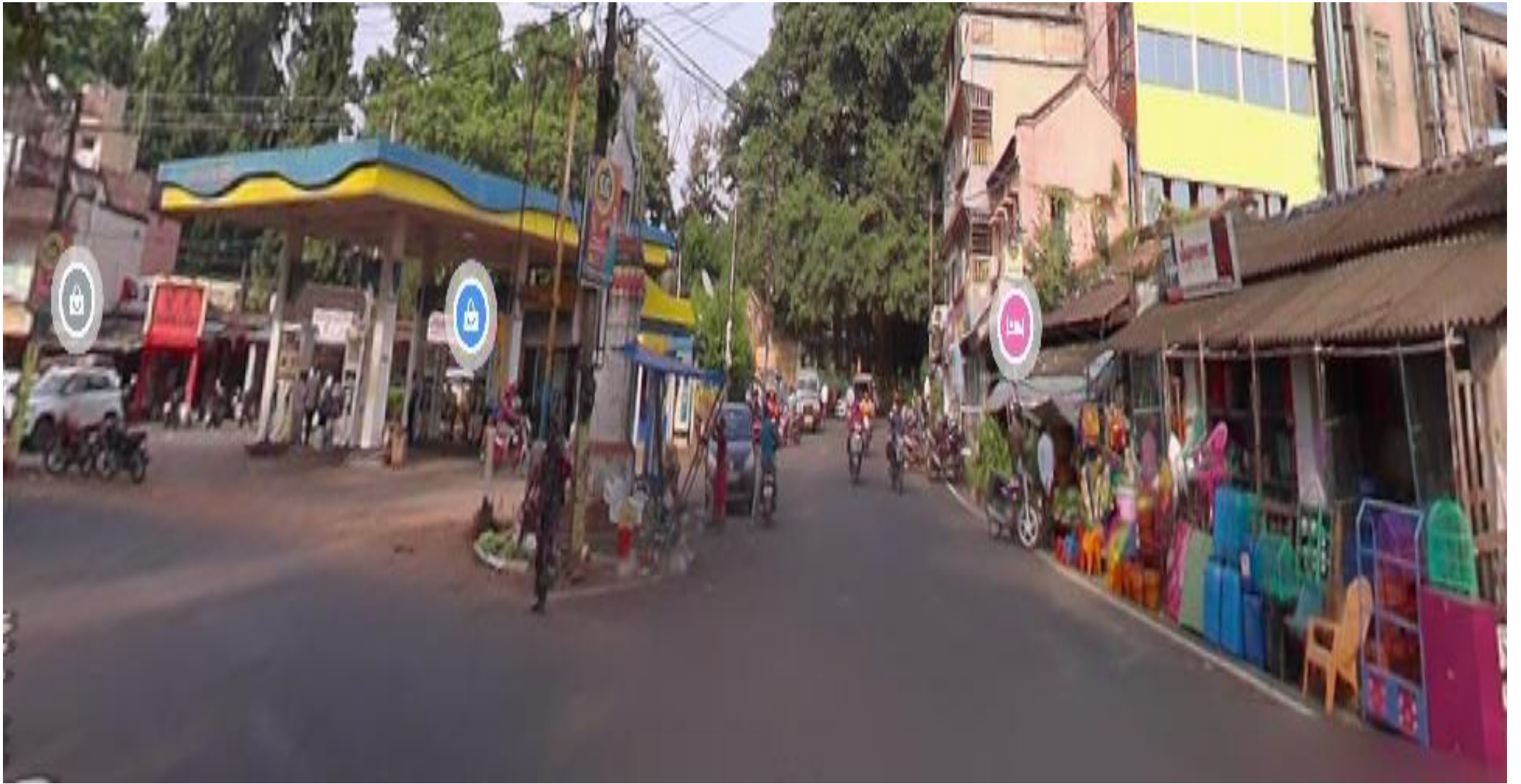
IMAGE: LEFT TURN ; Risk Level: HIGH ; Coordinates: 21.9367028, 86.7273767