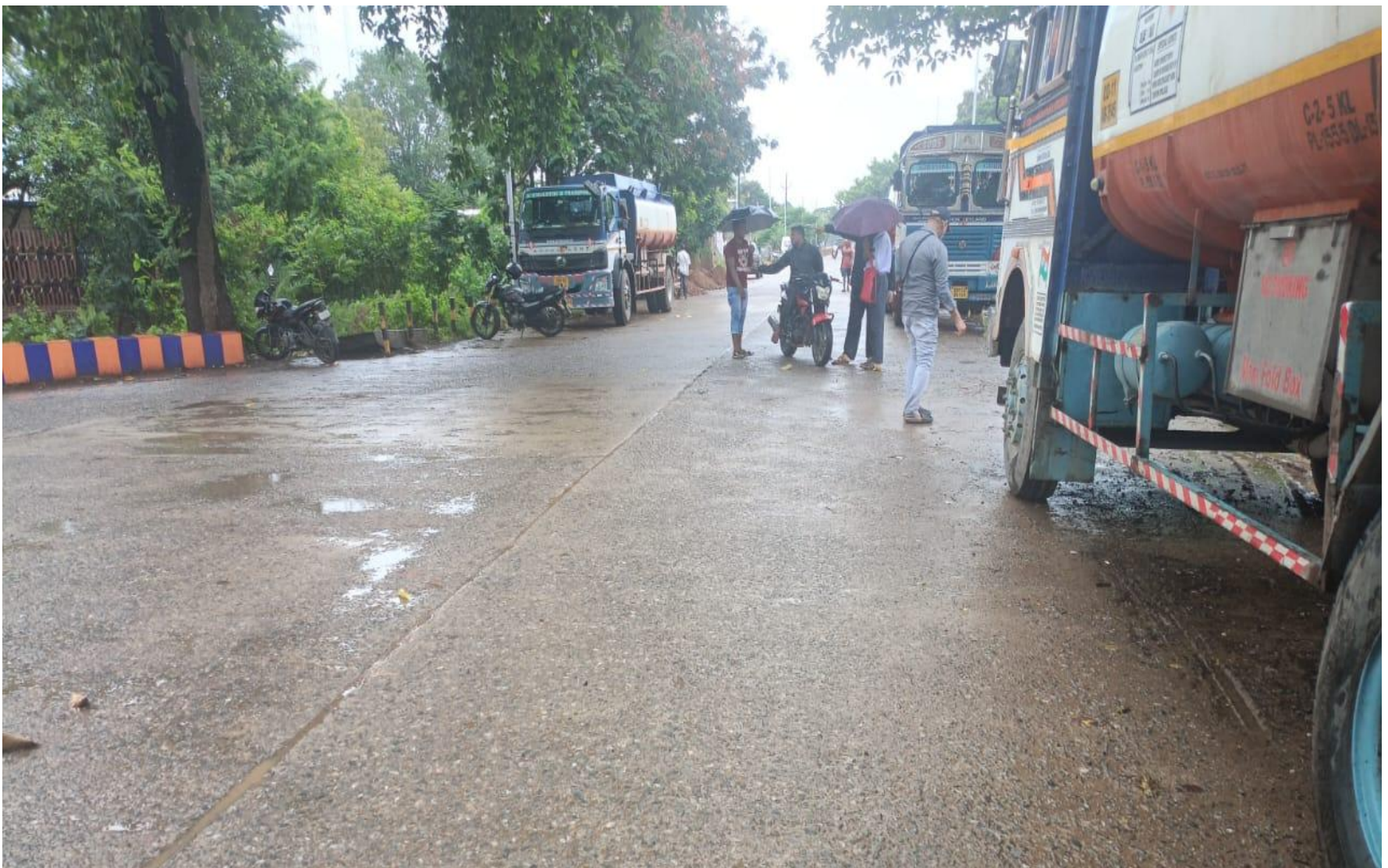
IMAGE: STRAIGHT ; Risk Level: MEDIUM ; Coordinates: 21.494401, 86.848468