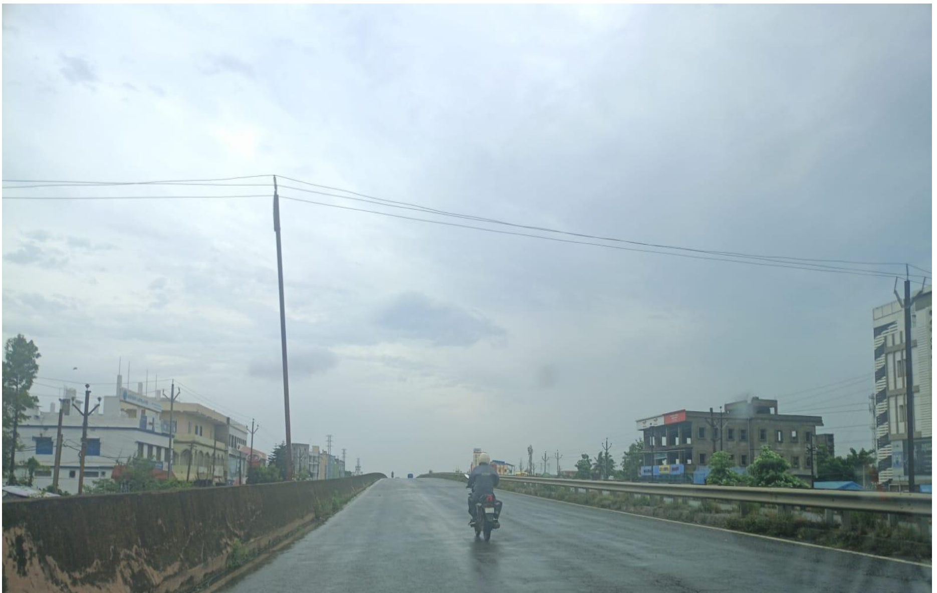
IMAGE: STRAIGHT ; Risk Level: MEDIUM ; Coordinates: 21.511436, 86.892188