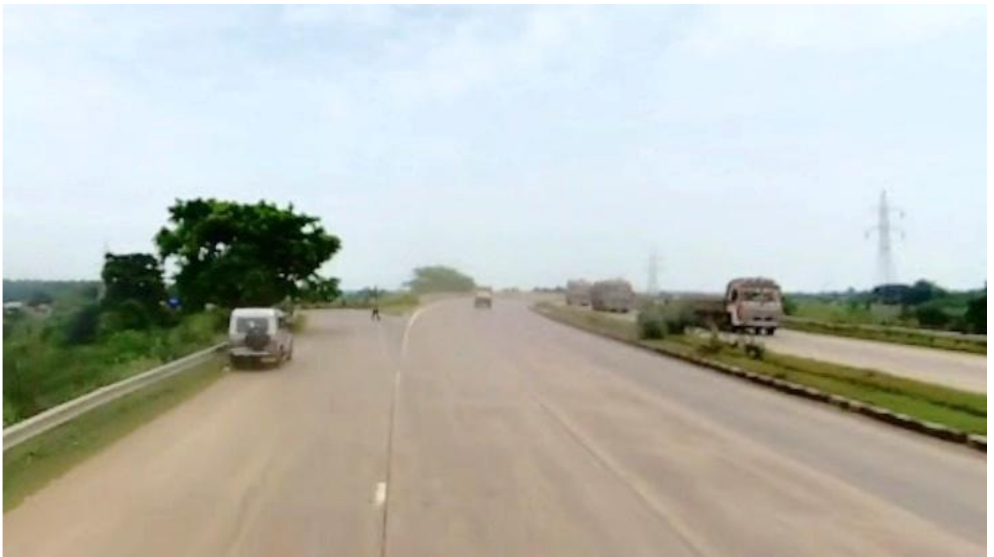
IMAGE: SHARP TURN LEFT ; Risk Level: HIGH ; Coordinates: 21.550605,86.9232643