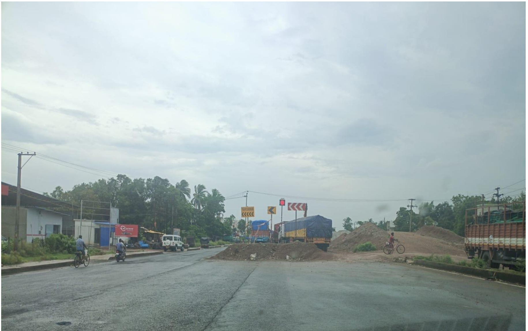
IMAGE: SHARP TURN LEFT ; Risk Level: HIGH ; Coordinates: 21.525135, 86.895252