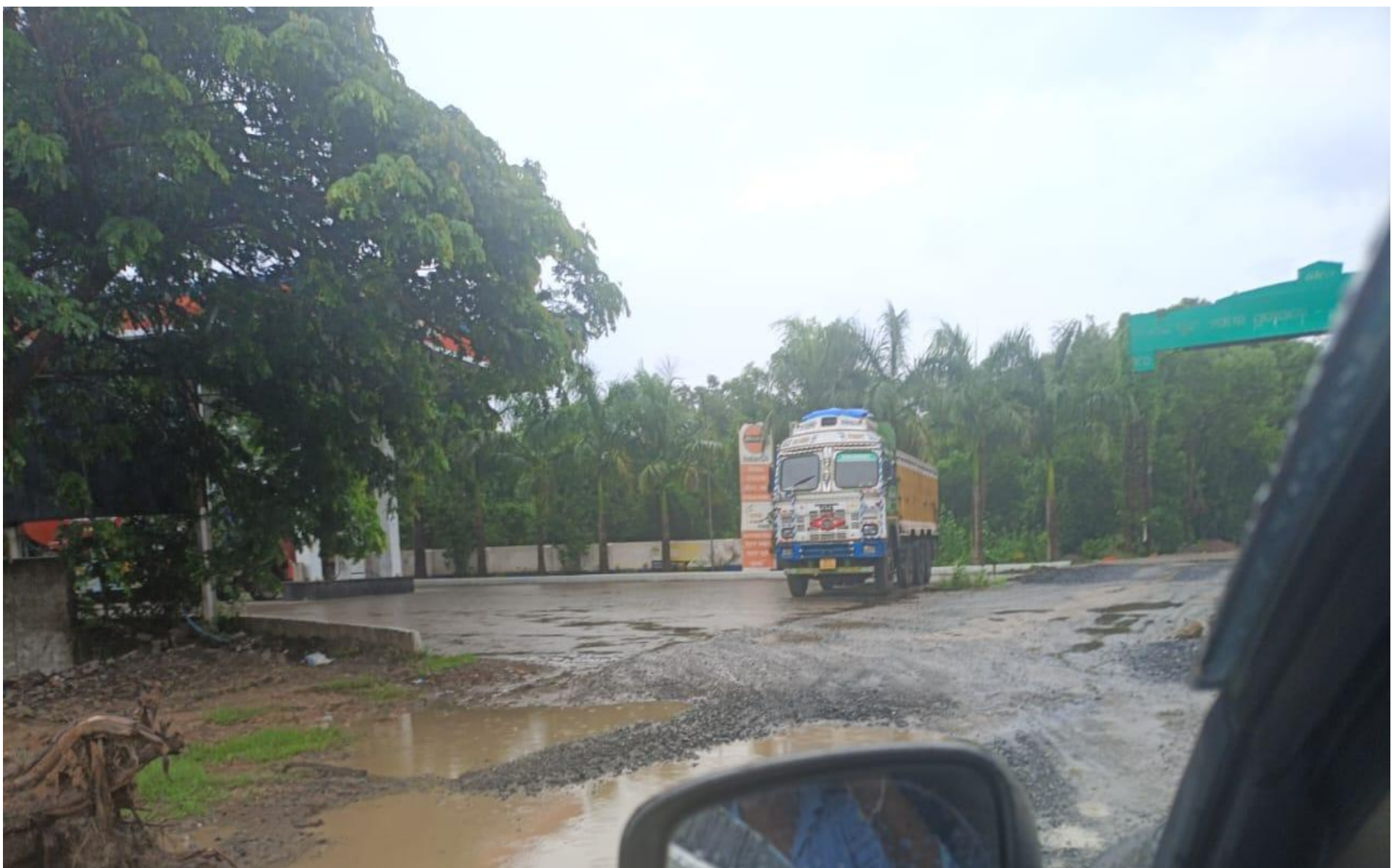
IMAGE: RIGHT TURN ; Risk Level: HIGH ; Coordinates: 21.491857, 86.858955