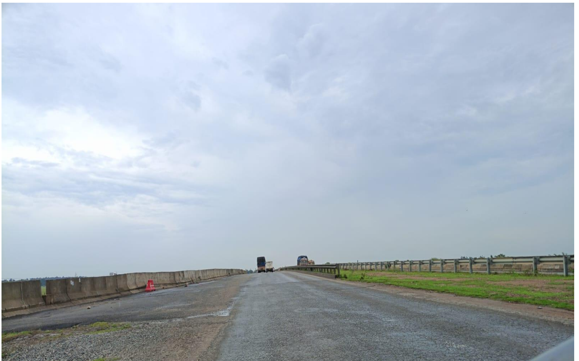
IMAGE: STRAIGHT ; Risk Level: HIGH ; Coordinates: 21.538488, 86.90128