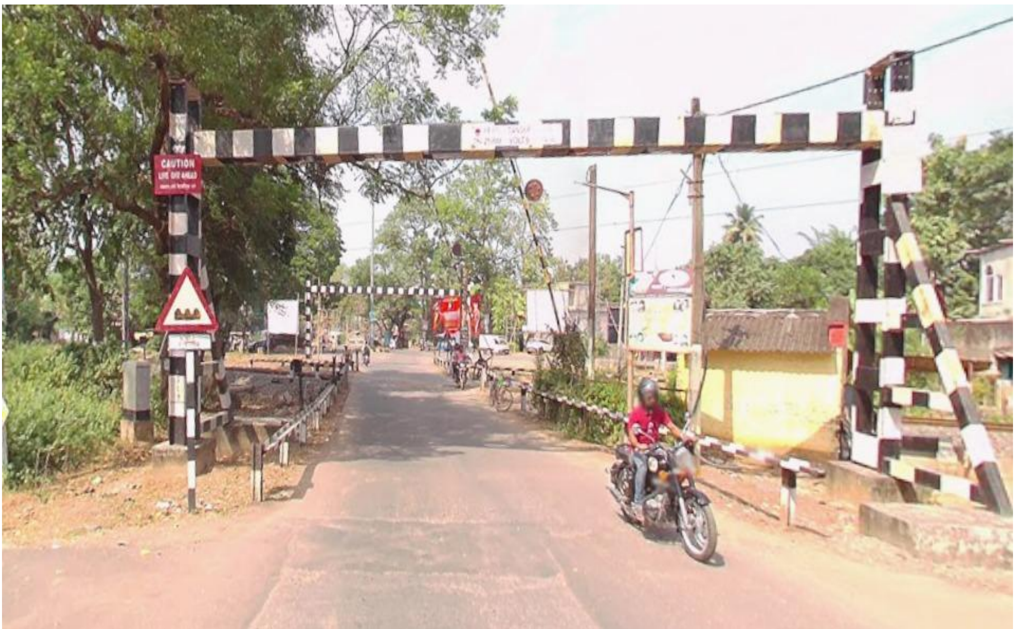
IMAGE: RAILWAY CROSSING ; Risk Level: MEDIUM ; Coordinates: 21.9199201,86.7435814