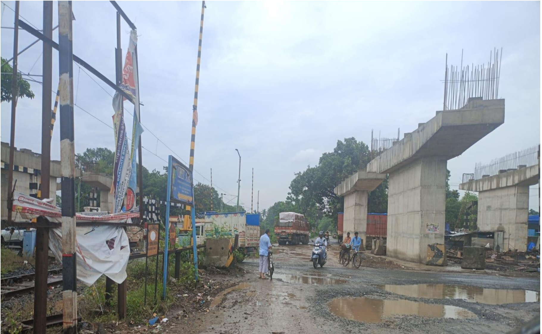
IMAGE: SHARP TURN LEFT ; Risk Level: HIGH ; Coordinates: 21.493375, 86.888745