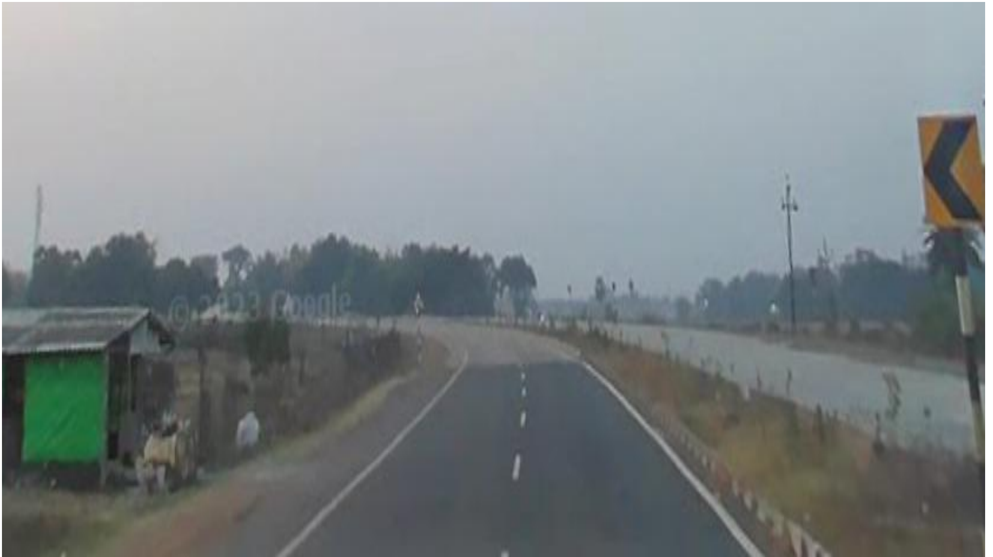
IMAGE: LEFT TURN ; Risk Level: MEDIUM ; Coordinates: 21.6977334,86.8773611