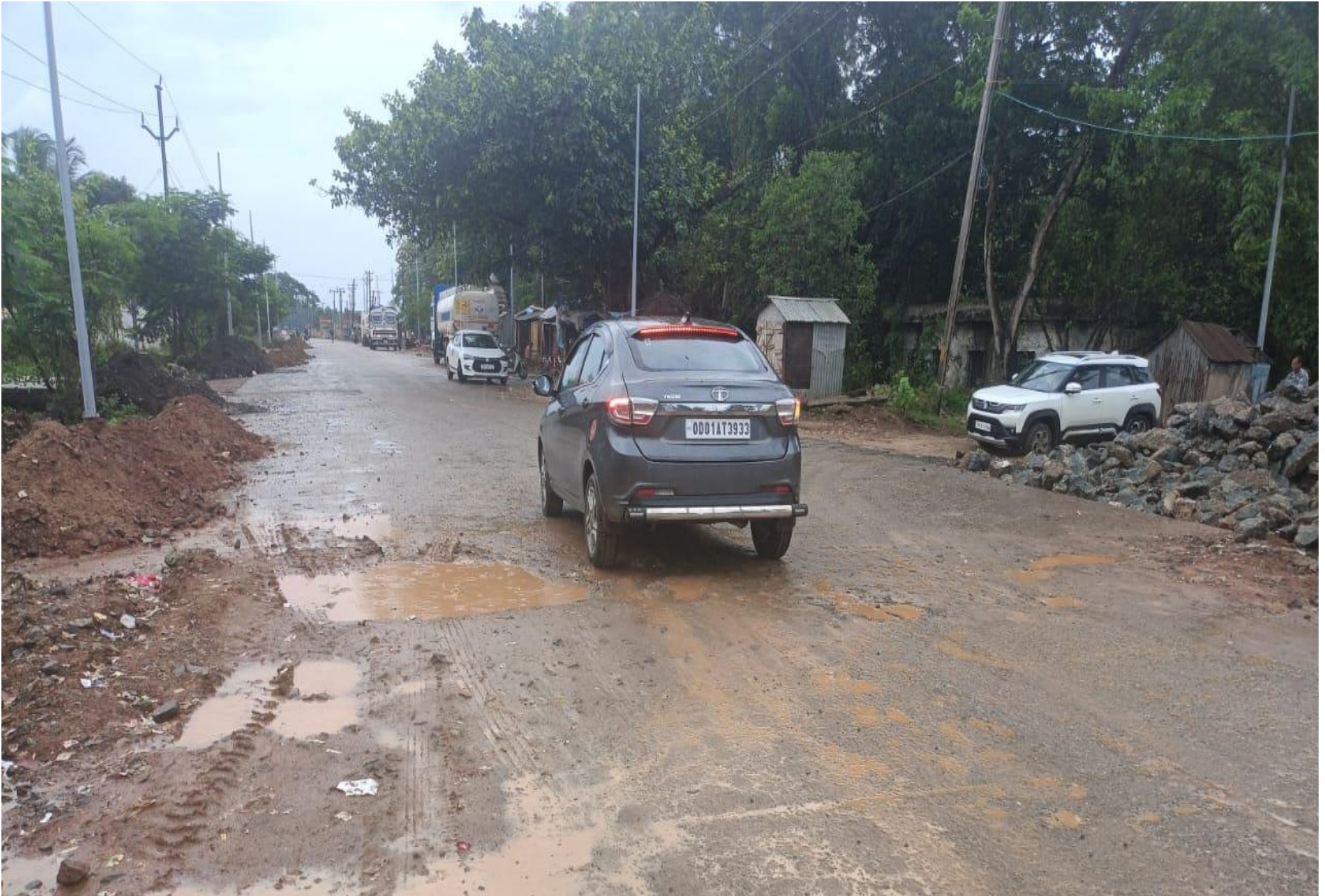
IMAGE: SHARP TURN RIGHT ; Risk Level: HIGH ; Coordinates: 21.495242, 86.84884