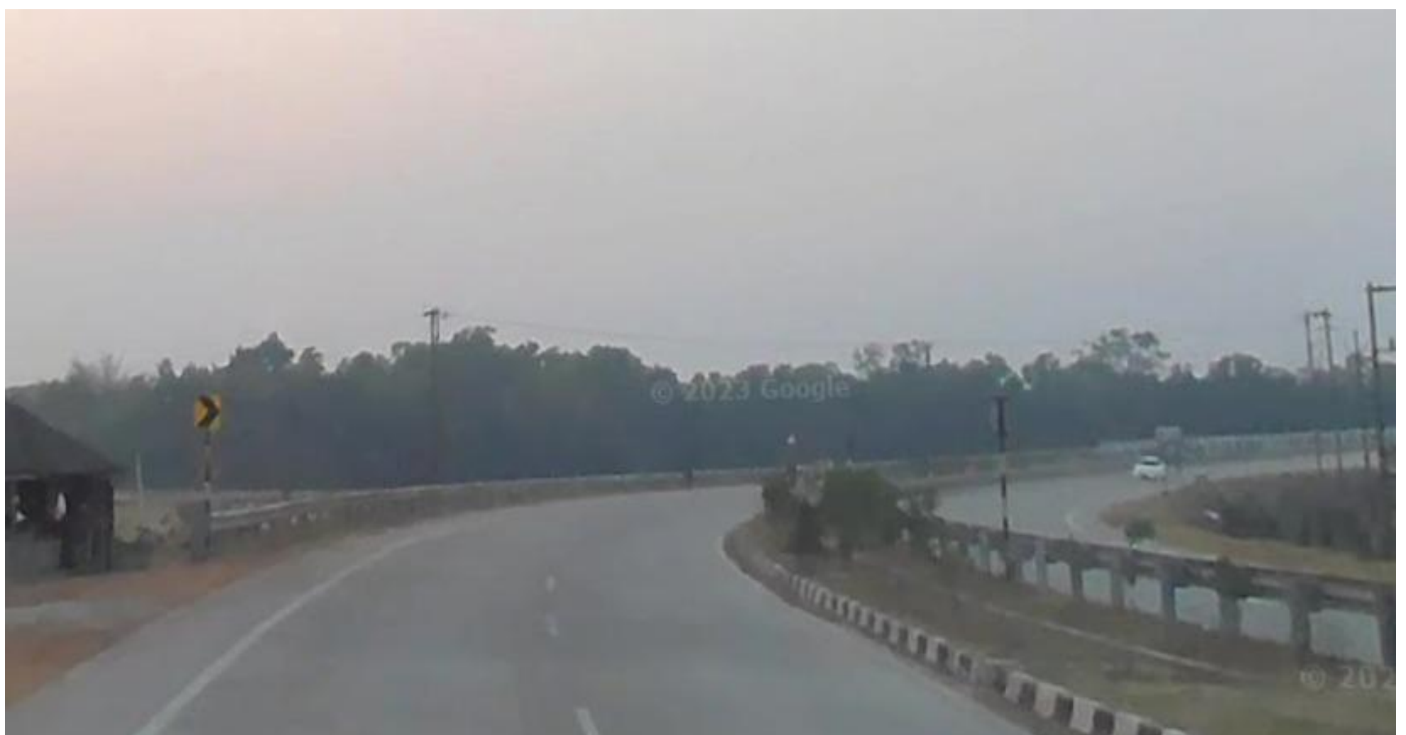
IMAGE: RIGHT TURN ; Risk Level: MEDIUM ; Coordinates: 21.700134,86.8730852