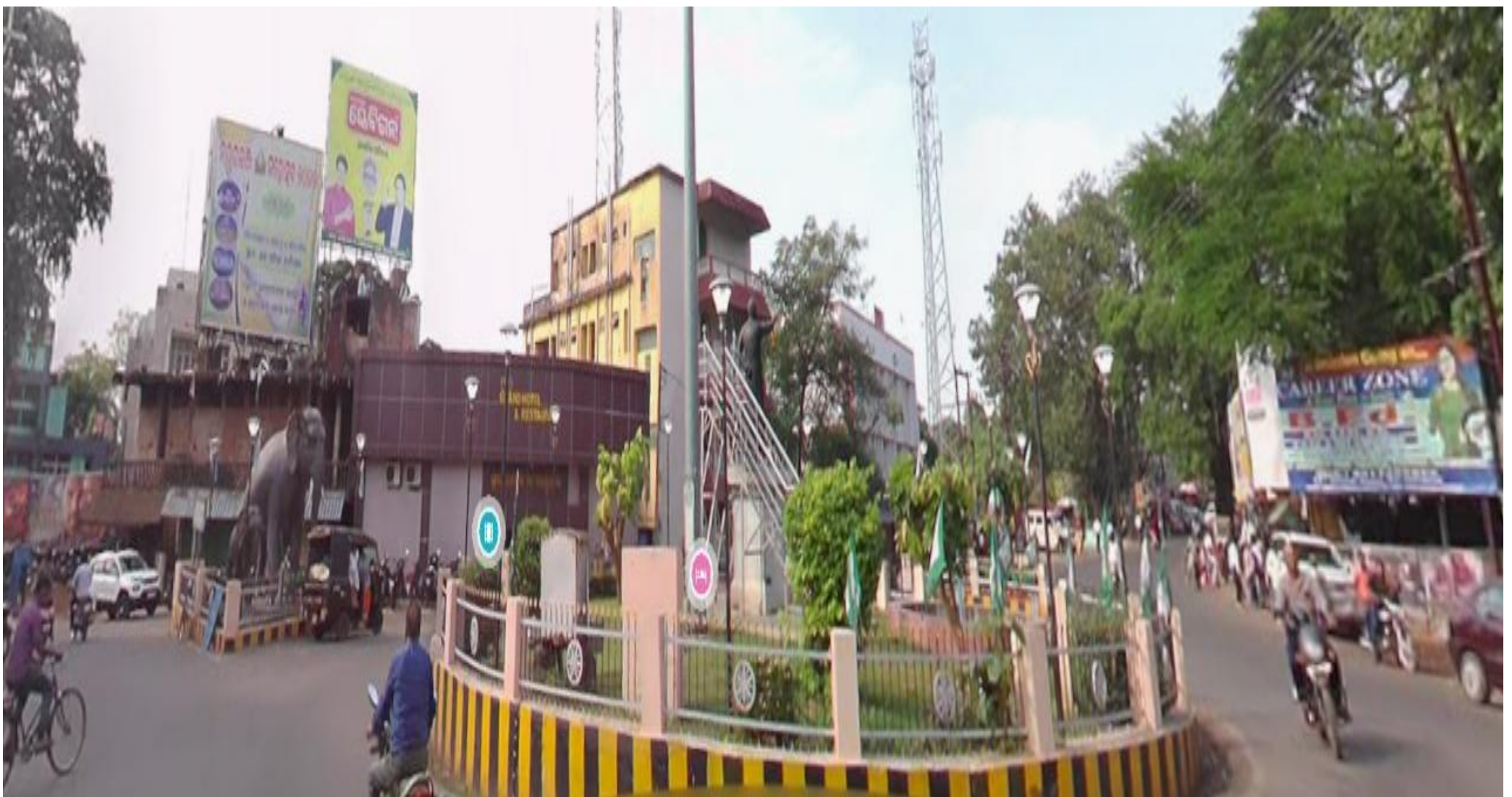
IMAGE: RIGHT TURN ; Risk Level: HIGH ; Coordinates: 21.938805, 86.727186